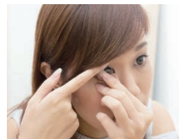
コンタクト卒業しませんか？

全性・信頼性ともに高いといえるでしょう。そう語る古賀院長は、県内で最初にICL手術を導入。これまで1100眼以上の手術実績があり、昨年はインストラクター資格も与えられた、プロフェッショナルです。