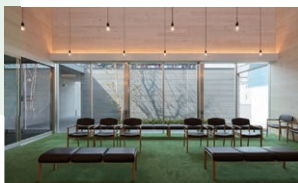
自然光と木の香りに包まれる待合室

全性・信頼性ともに高いといえるでしょう。そう語る古賀院長は、県内で最初にICL手術を導入。これまで1100眼以上の手術実績があり、昨年はインストラクター資格も与えられた、プロフェッショナルです。